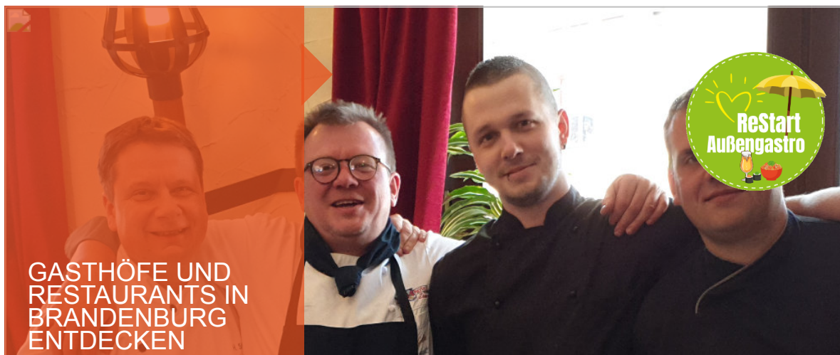
BURG HOTEL Ziesar in Ziesar